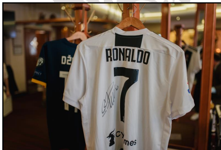
Dres Cristiana Ronalda