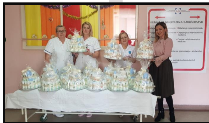
Uručenje poklon paketa za bebe rođene u Novogodišnjoj noći

Tako je Fondacija Junuzović Novu 2020. Godinu započela na jedan neobičan i veoma srdačan način i po ko zna koji put pokazala svoju humanost te obradovala mnoge majke darujući njihove novorođene bebe u toku novogodišnje euforije. Poklon paketi su uredno podijeljeni porodiljama i njihovim bebama, a cjelokupan projekat objavljen je na stranicama Fondacije Junuzović, portalima Soda Live i Tuzlanski.ba.