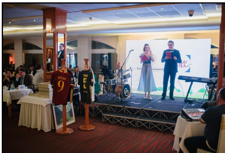
Aukcija dresova poznatih fudbalera