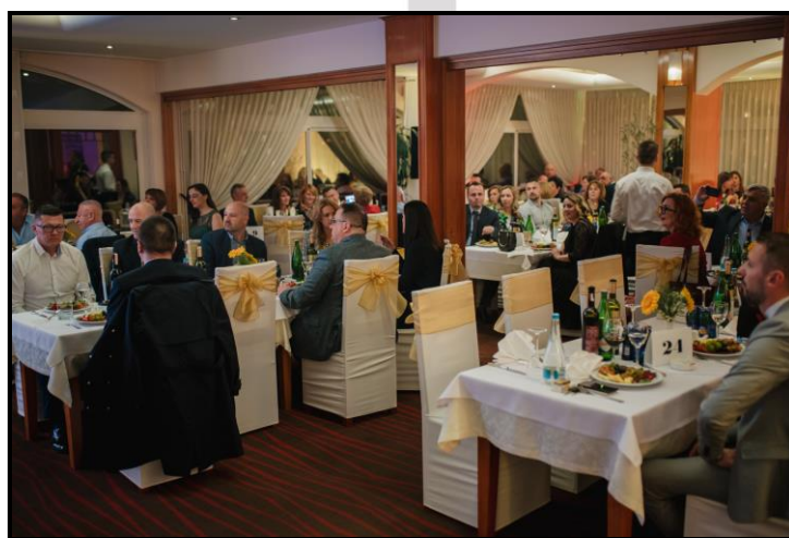
Donatorsko veče, Hotel Senad od Bosne

Donatorska večera 2019.godine je ponovila svoj prošlogodišnji uspjeh. Prikupljena su sredstva kako bi se nastavili radovi na Dječijoj klinici, a donatorima, našim gostima, veče je proteklo u ugodnoj atmosferi i prelijepom ambijenta Hotela Senad od Bosne na jezeru Modrac. Za kompletan ugođaj pobrinuli su se voditelji Erna Saljević i Tarik Filipović. Veče je uljepšala Aukcija dresova Edina Džeke, Miralema Pjanića, Cristiana Ronalda i Mirze Teletovića kao i Bon poznate BH dizajnerice, Belme Tvico. I na ovaj način prikupljena sredstva će se direktno donirati za adaptaciju Dječije klinike.